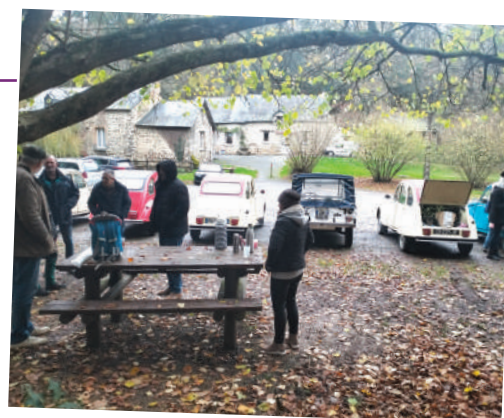
Les Deuches Torcéennes