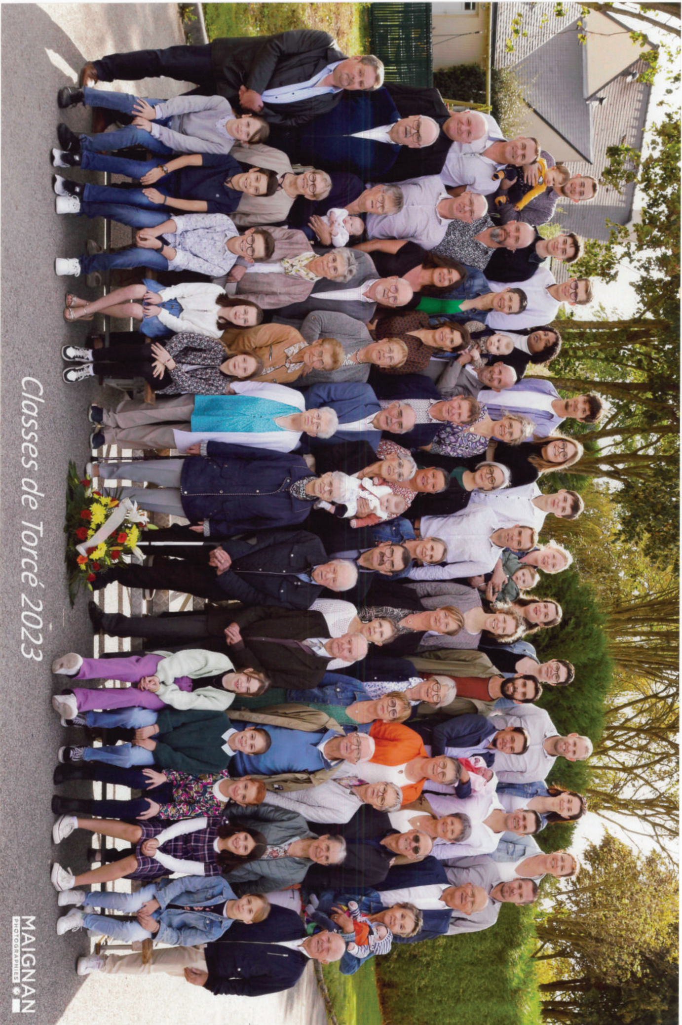
Classes de Torcé 2023