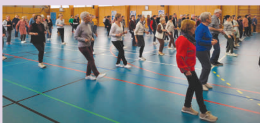
Danse en ligne du 27 novembre

Manifestations du club de la détente pour le 1 er trimestre 2024