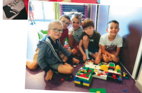
Les Legos constructeurs