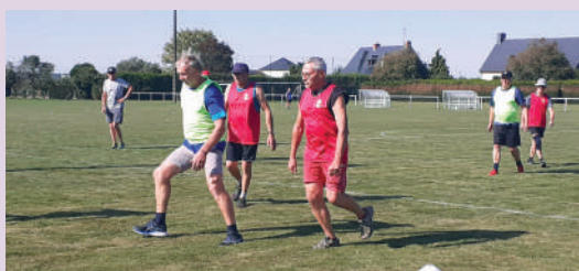
Foot en marchant du 10 octobre