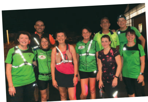
Créneau du mercredi soir