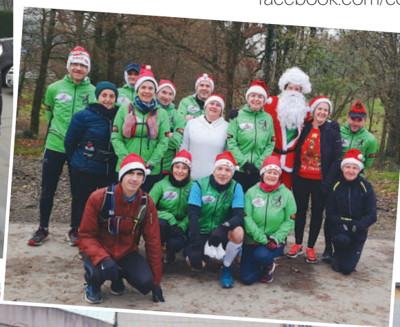
Sortie de décembre