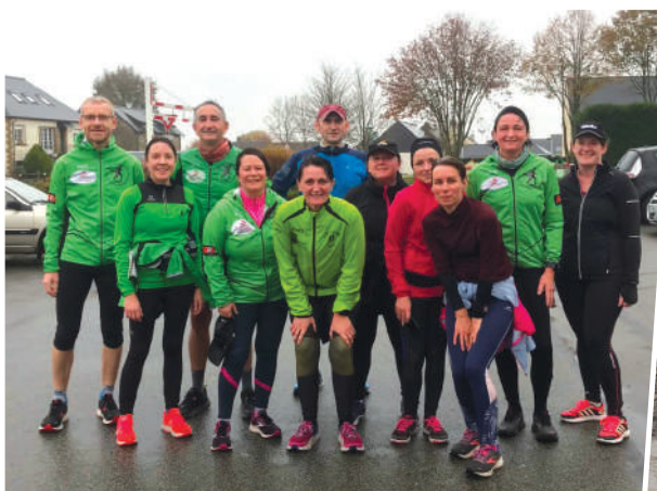
Créneau du samedi matin

Suivez la vie du club sur https://www.facebook.com/couriatorce .