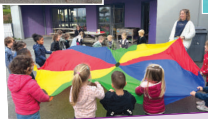
Jeu du parachute