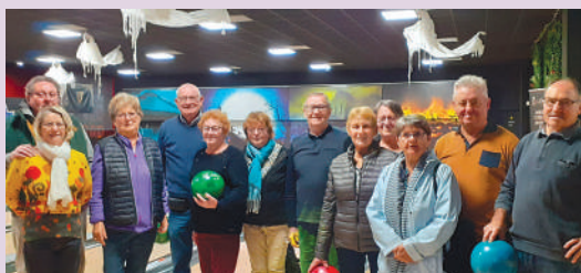
Bowling du 17 octobre

Quelques photos des manifestations qui se sont déroulées au cours du 4 e trimestre 2023.