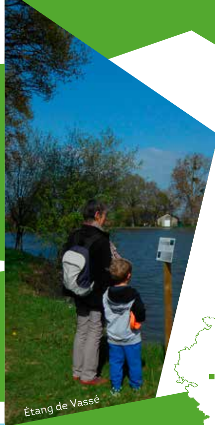
Étang de Vassé