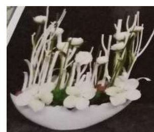
Bouquet réalisé lors de l'art floral de décembre pour les fêtes de fin d'année

Prochain rendez-vous, ce sera la galette des rois le 26 janvier 2020 !