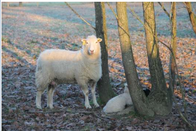
2 agneaux (un noir et un blanc) ont vu le jour début décembre

Le cheptel de la commune s'est étoffé avec l'arrivée de 2 ânes provenant d'un élevage de Mecé (35) : 1 âne de 8 ans baptisé Dartagnan et 1 ânesse de 4 ans baptisée Princesse. Il vont eux aussi contribuer au nettoyage des zones de pâturage du site de Vassé, au même titre que les vaches et les moutons.