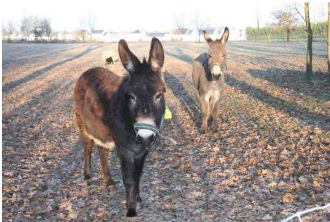
A gauche, Princesse et à droite, Dartagnan

Ces ânes semblent apprécier la visite des promeneurs, mais attention, si vous souhaitez leur apporter du pain ou des carottes, il faut jeter la nourriture au sol et non pas les laisser la prendre dans la main sous peine de se faire mordre !!! Pour info, la durée de vie d'un âne est de 35/40 ans.