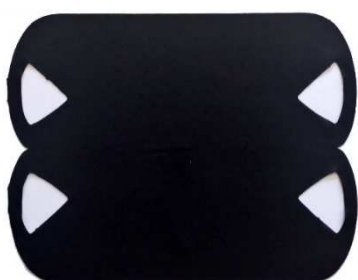
Masque à plat.